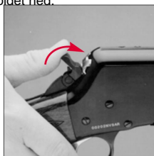
Foldehammer-funktionen roterer fremad for ekstra sikkerhed.

I halvhanepositionen kan den øverste del af hammeren drejes fremad med tommelfingeren for at placere hammeren mod boltens bagside, uden at komme i kontakt med den bageste del af slagstiften. Dette