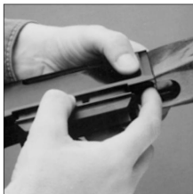
Træk ned for at frigive magasinet