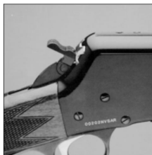
Faldet eller affyret stilling