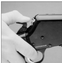
Sænkning af hammeren